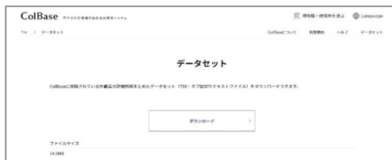
ColBase データセット ダウンロード画

※1:e 国宝のアクセス件数については、2年度のリニューアルにより件数集計方法が変更されたため、元年度までのアクセス件数を参考値とした。リニューアル後の2年11月1日～3年3月31日のアクセス件数より、1年間分のアクセス件数を算出し、目標値とした。