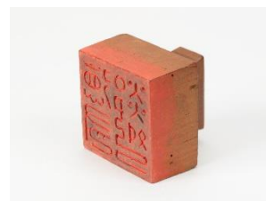
重要文化財「徳有鄰」印