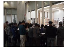
文化財保存修理所特別公開